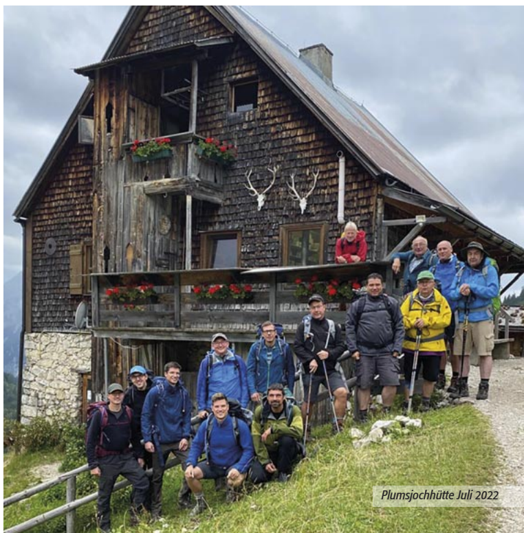
Plumsjochhütte Juli 2022