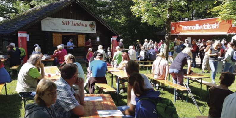
WirWunder Mai 2022

Weitere Infos bitte der Tagespresse entnehmen. Treffpunkt: 8:30 Uhr mit PKW beim Netto-Markt Lindach. Infos und Anmeldung bis Ende Mai 2023 bei: Bernd Maile, Tel. 07171-72405