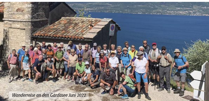
Wanderreise an den Gardasee Juni 2022