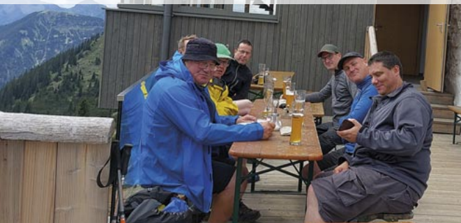
Hüttenwanderung Karwendel Tölzer Hütte Juli 2022