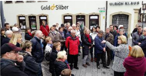
Stadtführung in Schwäbisch Gmünd im März 2018