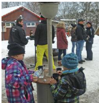
Schlittenfahren mit Après-Ski, Januar 2017