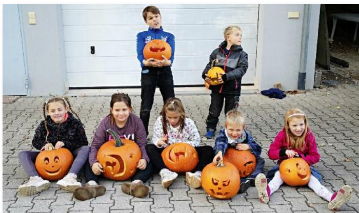
Kürbisschnitzen im Oktober 2018