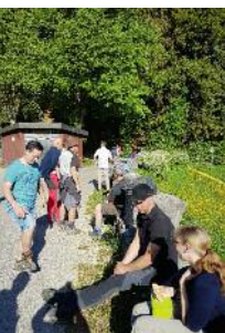
12 Stunden- Wanderung 2018

Mit dem Bus fahren wir zum Musikerheim nach Gmünd. Von dort aus geht es durchs Hölltal, am Albtrauf entlang, zum Franz-Keller-Haus, über den Bernhardus zum Kolpinghaus und wieder zurück zum gemeinsamen Abschluss in Lindach. Genauere Wegbeschreibung im Mitteilungsblatt. Wegstrecke: 37 km. Treffpunkt: 6:45 Uhr beim Netto-Markt Lindach. Info und Anmeldung: Jochen & Pascal Abele, Tel. 07171-777598 und Bernd Abele, Tel. 07171-77675