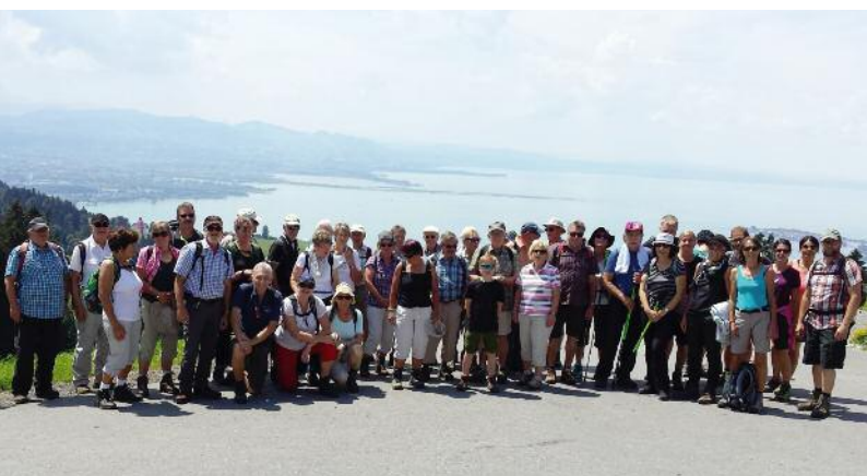
Auf dem Höhenweg von Scheidegg zum Pfänder im Juli 2018