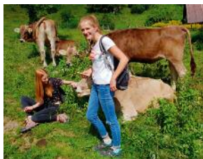
Vater-Kind-Wochenende im Juni 2018 in Bühl am Alpsee