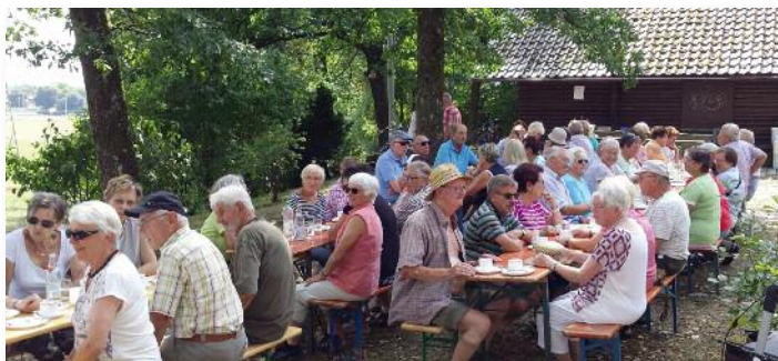
Seniorenachmittag im August 2018